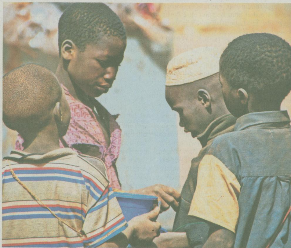
Gibst Du mir, gebe ich Dir: Jungen beim Feilschen auf dem Markt in Kongoussi