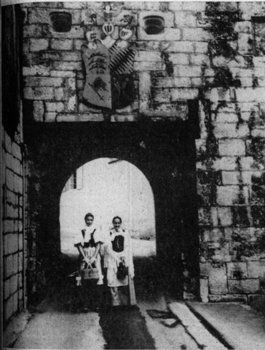
Mädchen in der Tracht von Montbéliard posieren am Tor des Schlosses, über dem das Wappen angebracht ist. Im linken unteren Teil zeigt es das Wappen von Ludwigsburg.