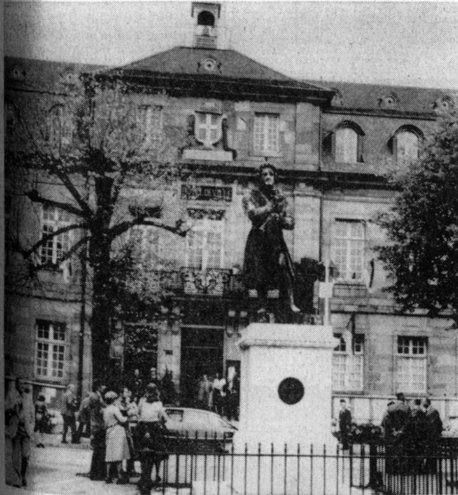
Festlich ist das Rathaus von Montbéliard zum Empfang der Delegation aus Ludwigsburg geschmückt.