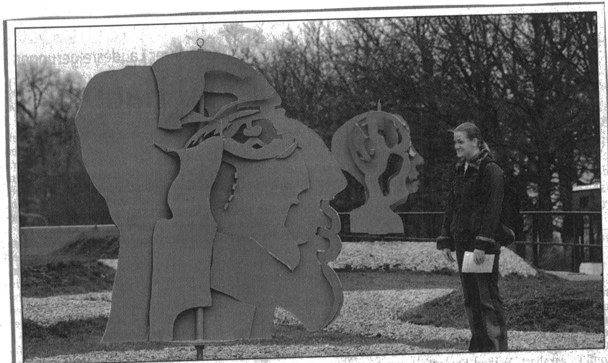
Gorgonenköpfe gibt es jetzt in Ludwigsburg auf der Stern-Kreuzung zu sehen. Die Winterdekoration mit Anleihen aus der griechischen Mythologie wurde im Auftrag der Stadt von Studenten der Pädagogischen Hochschule Ludwigsburg angefertigt (mehr darüber auf Seite 17).

LUDWIGSBURGER KREISZEITUNG vom _____ STUTTGARTER ZEITUNG vom _____ STUTTGARTER NACHRICHTEN vom _____ BIETIGHEIMER ZEITUNG vom 28.11.2003