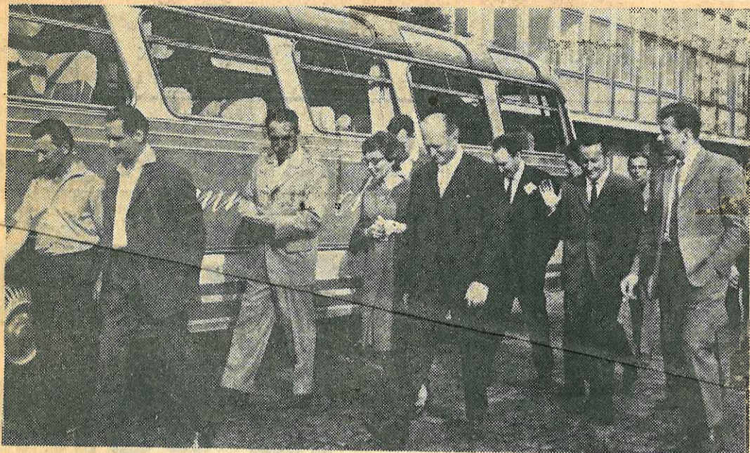
Le groupe de Ludwigsburg pendant la visite de la Brasserie.