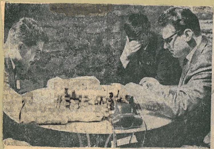
Le tournoi d'échecs franco-allemand s'est soldé par un nul.

Hier matin, sur le coup des 10 h., la délégation sportive et culturelle de Ludwigsburg a pris congé de ses hôtes montbéliardais. En fait, ce n'était qu'un au revoir puisque, dès vendredi, les judokas, escrimeurs, handballeurs, tireurs, footballeurs et joueurs d'échecs, se retrouveront dans la cité allemande, où ils disputeront, dans un même esprit d'amitié, le match retour.