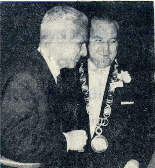
Les premiers magistrats des deux villes jumelles se retrouveront dès ce soir, samedi

Voici un aperçu du programme : chœurs classiques et romantiques (Mehul, Gluck, Beethoven, Schubert, Silcher), ainsi que chœurs modernes et chansons populaires.