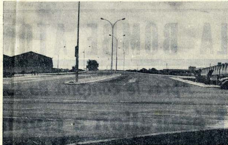
Voici, déserte juste le temps de prendre un cliché, la future avenue de Ludwigsburg, qui sera inaugurée, dimanche matin. Actuellement, on appelle cette artère qui prend naissance, avenue d'Helvétie, et conduit à Audincourt-Valentigney, bretelle routière

En effet, comme nous le savons déjà, le conseil municipal de Montbéliard a décidé d'appeler : « Avenue de Ludwigsburg », la nouvelle bretelle routière qui va du carrefour (avenue Chabaud-Latour - avenue d'Helvétie), à la route d'Audincourt.