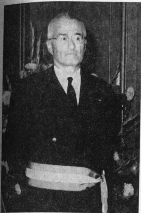
Im goldenen Buch der Stadt dokumentiert: Die „Silberhochzeit“ echter Freundschaft