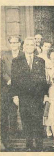
Les deux délégations au grand complet devant la mairie de Ludwigsburg